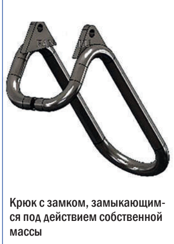
Крюк с замком, замыкающимся под действием собственной массы