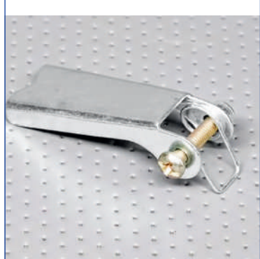
Крюк с замком пружинного замыкания